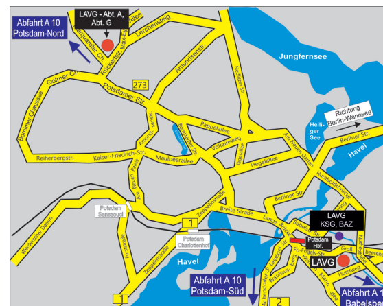
Ausschnitt aus dem Stadtplan