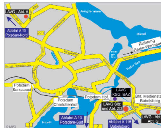
Ausschnitt aus dem Stadtplan